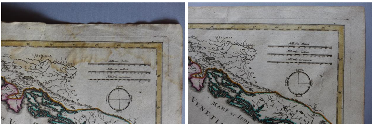
A 20. sorszámú térképen levő vízfolt részlete restaurálás előtt és után

A térképek állapota: A dokumentumok rézmetszettel készített, utólag kifestett térképek, egy rézmetszettel készült címlap és egy nyomtatott regiszter. A hosszában félbehajtott térképlapokat egykor a hajtáshoz ragasztott papírsíkkal fűzhatték köteté. A ragasztás nyomai, ill. néhol a papírsík maradványai is megtalálhatóak a hátoldalakon. A kötés elveszett.