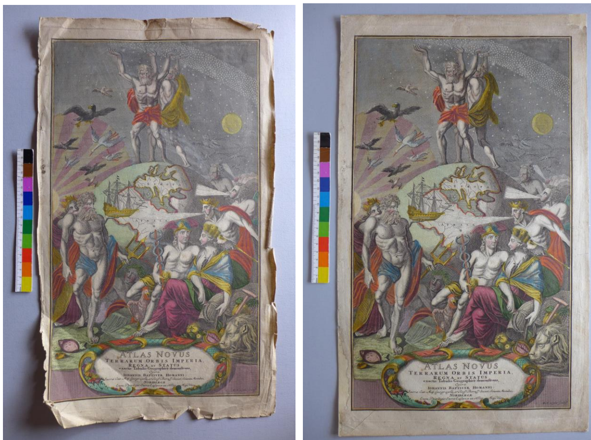
A címlap restaurálás előtt és után

A restaurált dokumentumok: Homann, Johannes Baptist: Atlas Novus. – Nürnberg, 1716-tól, 46 db térkép (hiányos) és címlap, jelzete: T.359., 16 db rézmetszettel készített térképlap és 1db címlap. A térképek mérete kb. 62x55cm, a címlap mérete 54,5x32,2 cm.