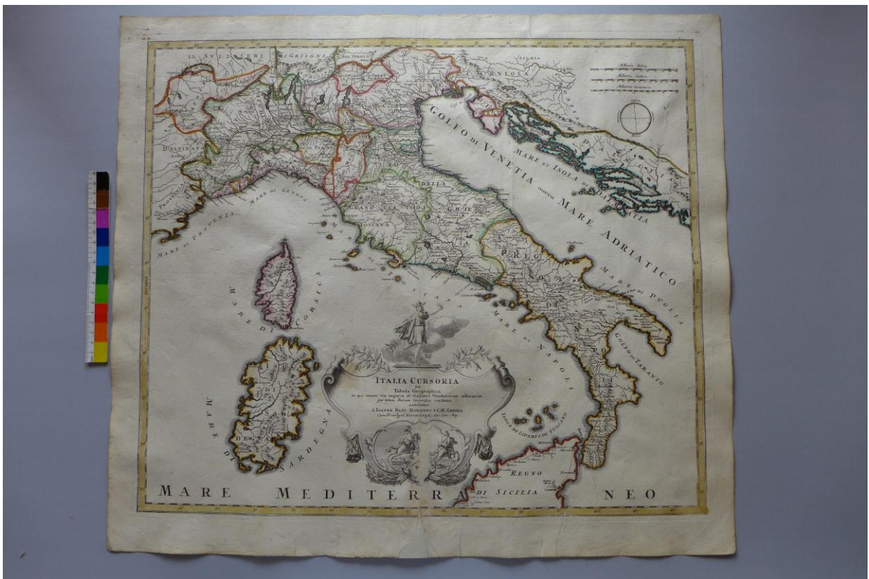
A 20. sorszámú térkép restaurálás előtt és után