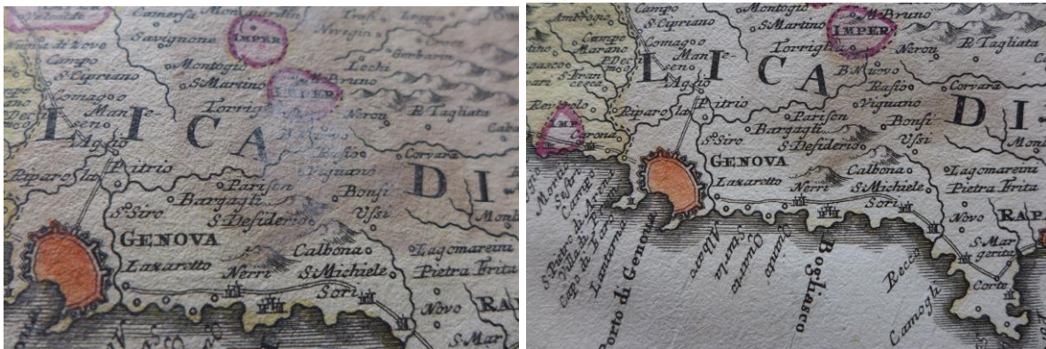
Fehéres penészpórák a 32. térkép felszínén a restaurálás előtt és a megtisztult terület a munka végeztével

A lapszélek szennyezettek , porosak, néhol sáros üledékkel, hajtásokkal, gyűrődésekkel, szakadásokkal. A felületeket penész eredetű, áttetsző, finom fehéres por fedi. A címlap hátoldalán fölül madárürülék nyomai, a folt a színoldalra is áttért.